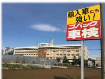
解体前の旧1号館。「ASIA U」のロゴが印象的で当社からもよく見えました。