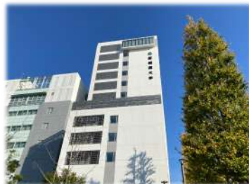
新しく建てられた地上14階建ての新1号館。新たなランドマークとなりました。