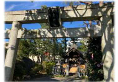
大学敷地内の興亜神社。ここに戦争に出征して亡くなった97人の同窓生が祭られた碑があります。