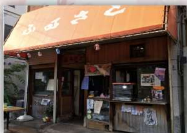
2020年6月に閉店した、団子屋「ふるさと」。いつの時代も地域の全ての人から愛されるお店でした。