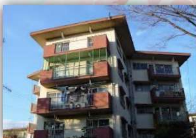
桜堤にもあったY字型の住棟、通称「スターハウス」。S30年代の花形です。現存する物の中には登録有形文化財に指定されたものも！

最近では複合施設「なりわい賃貸住宅hocco（ホッコ）」が出現！好きなこと、得意なことを六畳ほどの軒先で生業としてスタートしたり、アトリエとして空間を開放したりすることが出来るそうです。新しいコミュニティの創出が期待できそうですね。次回詳しくご紹介します。