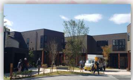
再開発が進む桜堤。2021年秋にオープンしたhocco（ホッコ）は、小田急バス・シェアカー・シェアサイクルの拠点にもなっています。